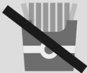
Frituras de qualquer tipo (batatinha, bolinhos etc.)