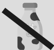
Leite de vaca (não oferecer até um ano)