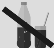
Café, chá preto ou mate, refrigerante ou suco em pó