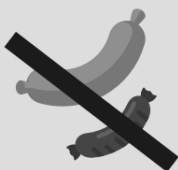
Produtos industrializados ou com conservantes (nuggets, salgadinhos, mortadela, presunto, salsicha)