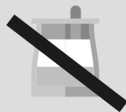
Mel (não oferecer até um ano)