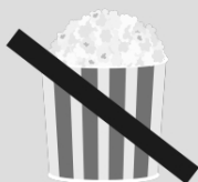
Pipoca (não oferecer até os quatro anos)