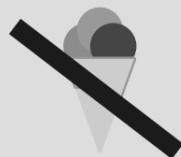
Doces e guloseimas (bala, goma, picolé, sorvete)